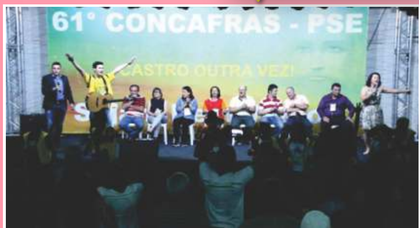
Fé, esperança e alegria foram os instrumentos que deram suporte ao congresso em Castro