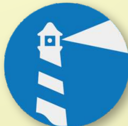
Aplicativo Reforma Íntima

Para ele, a tendência é que o aplicativo se torne cada vez mais conhecido, para atender ao público espírita e não espírita. “Não é algo estático, há interação entre as pessoas e o aplicativo, no auxílio da reforma íntima. Esta foi a proposta da editora: falar a língua moderna, a linguagem digital e de aplicativos”, conclui o jovem. Para mais informações sobre o Programa de Apoio a Reforma Íntima e como implanta-lo na Casa Espírita, acessar www.ocentroespirita.com e ver o livro Reforma Íntima - como tornar sua vida melhor, da Editora Auta de Souza.