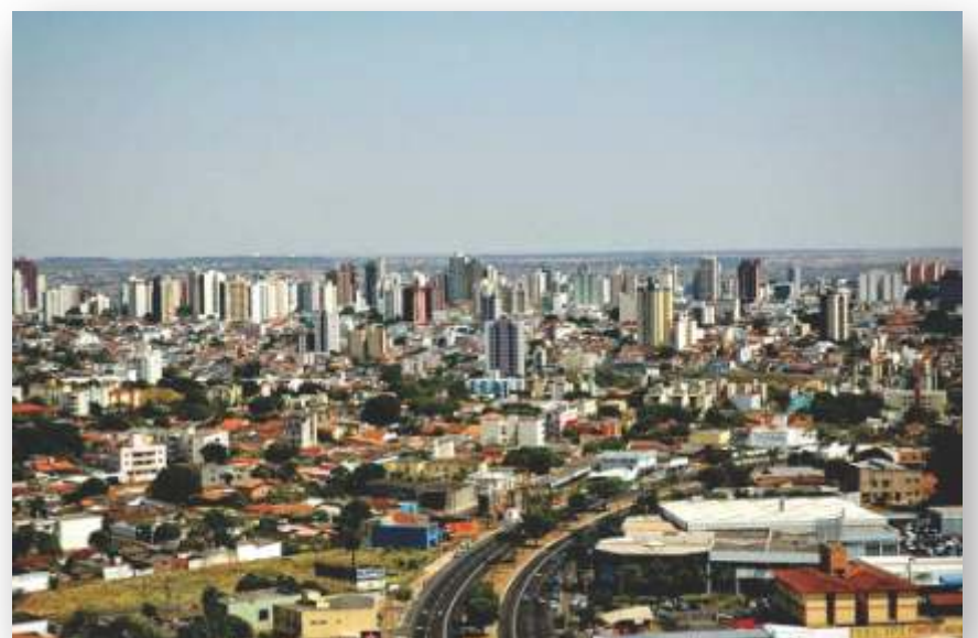
Uberlândia conta com uma localização privilegiada