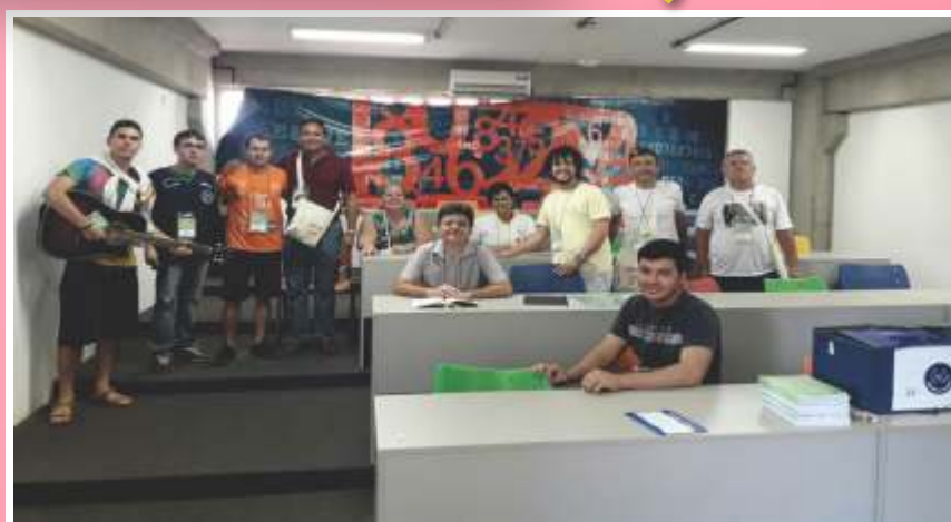
A receptividade de Frutal contagiou os caravaneiros.