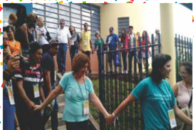
Caravaneiros em atividades