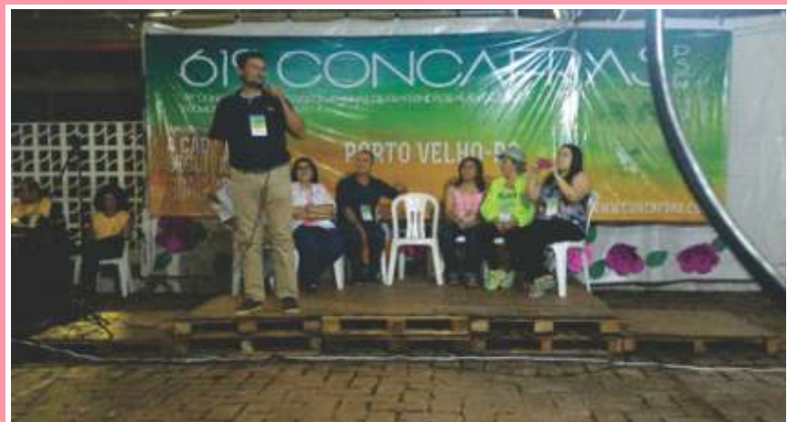
Porto Velho promoveu uma festa de bênçãos na realização da Concafras