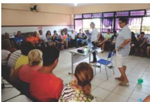
Caravaneiros participando dos estudos de temas diversos