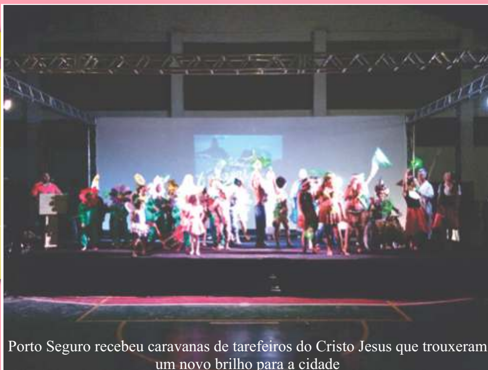
Porto Seguro recebeu caravanas de tarefeiros do Cristo Jesus que trouxeram um novo brilho para a cidade