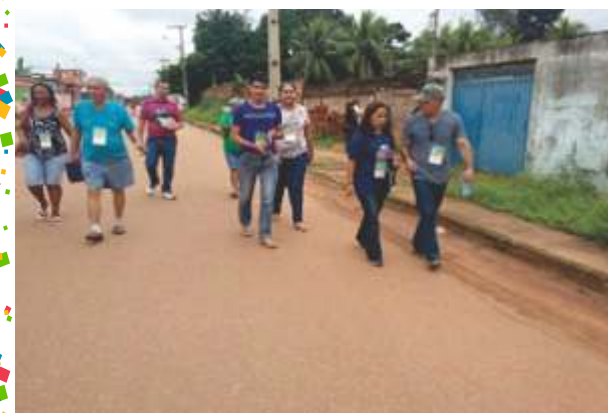
Caravana da Campanha de Fraternidade Auta de Souza