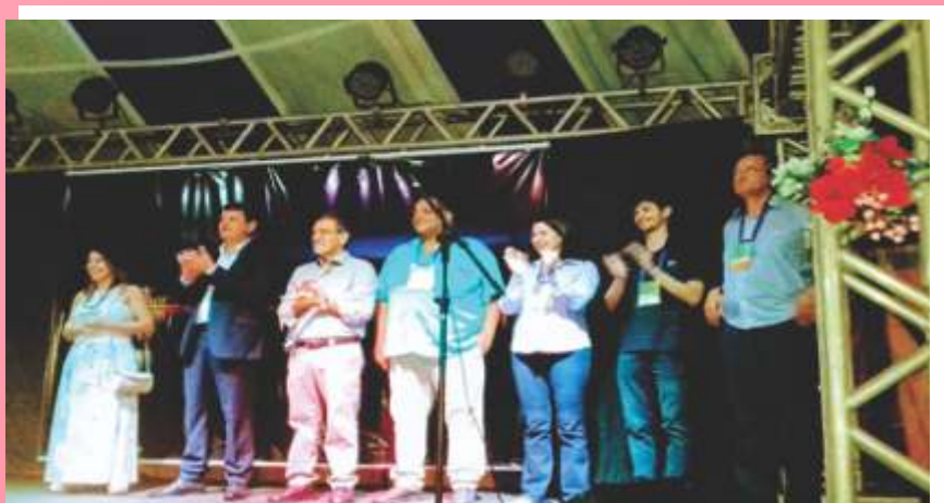
Porangatu deu exemplo de amor e fraternidade ao receber caravaneiros do Brasil e exterior