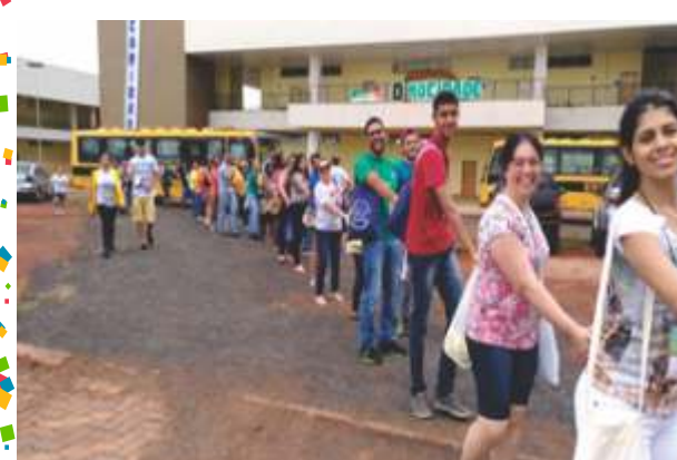
Caravaneiros deslocando para as CFAS