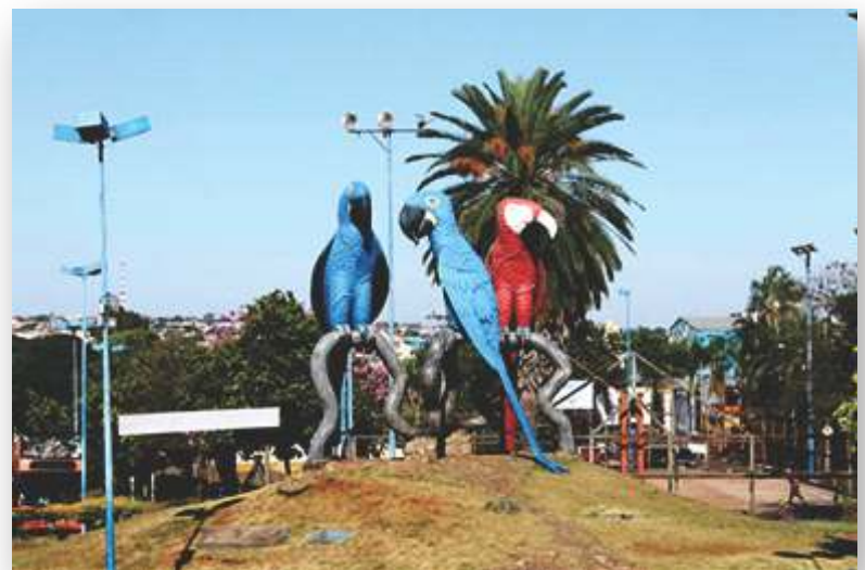
Campo Grande – MS, cidade morena

Grande encontro anual de treinamento de trabalhadores espíritas, o evento tem reunido cerca de 6 mil participantes de todo o Brasil e do exterior. Em clima de intensa fraternidade, os participantes trocam experiências e conhecimentos durante os quatro dias de evento, sempre realizado no período do carnaval. Acompanhe as novidades pelo site www.concafras.com e pela fanpage Concafras-PSE.