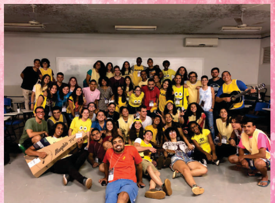
Presença jovem em Uberlândia