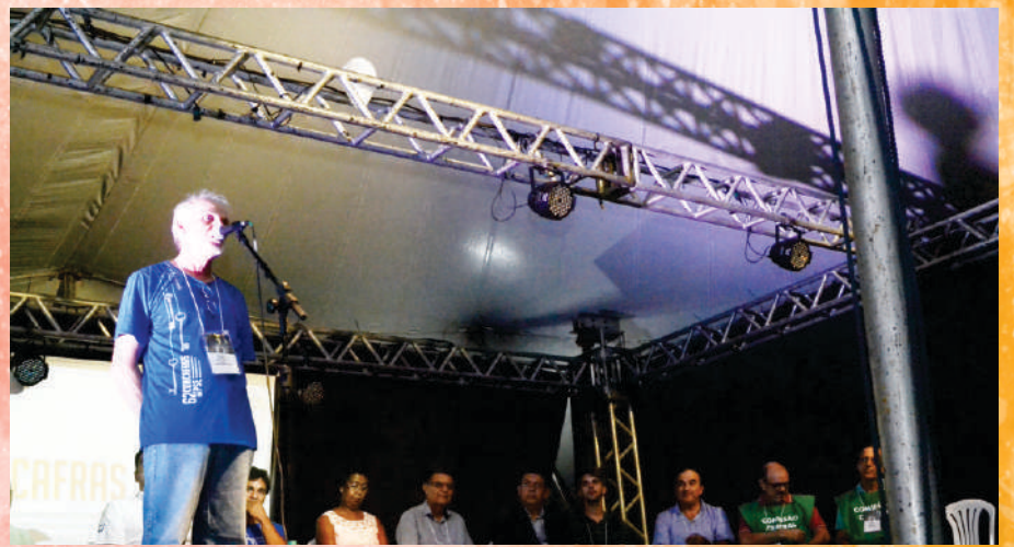
Diomar - abertura da CONCAFRAS - Uberlândia - MG