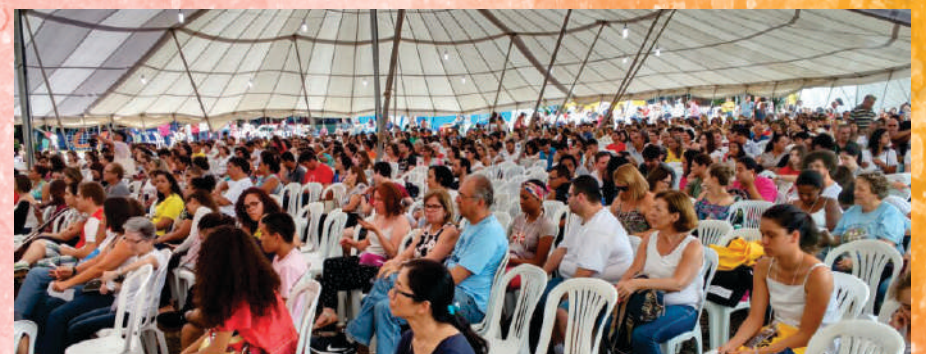
Público presente na CONCAFRAS de Uberlândia