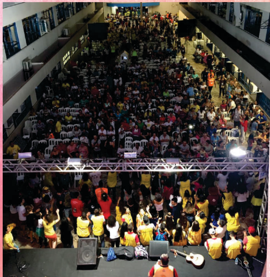
Vista do público presente na CONCAFRAS em Campo Grande