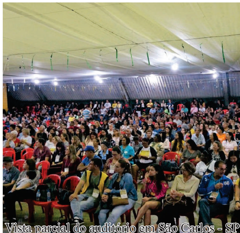
Vista parcial do auditório em São Carlos - SP