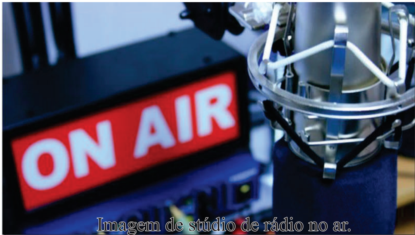
Imagem de estúdio de rádio no ar.