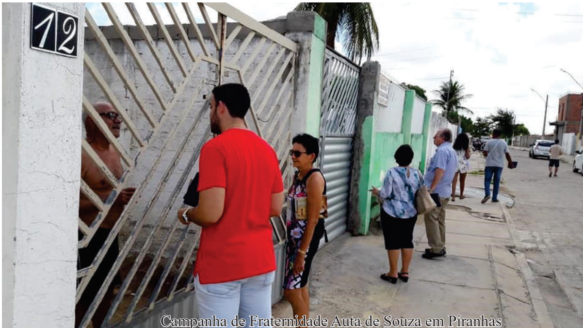
Campanha de Fraternidade Auta de Souza em Piranhas

mais casas, para ajudar mais pessoas e automaticamente nos ajudar também”.