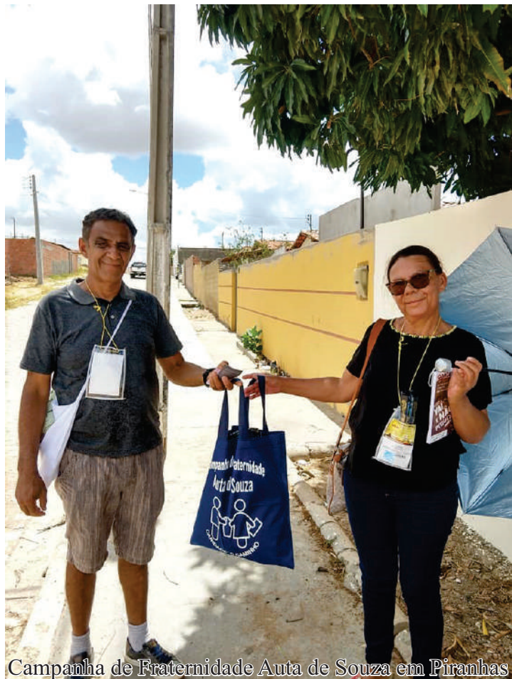
Campanha de Fraternidade Auta de Souza em Piranhas