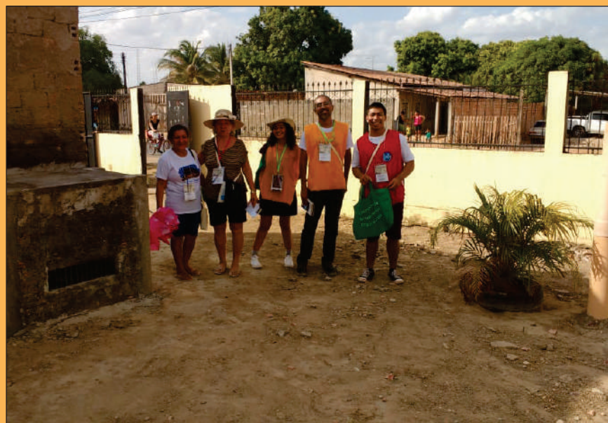
Campanha de Esclarecimento Chico Xavier, em Boa Vista (RR)