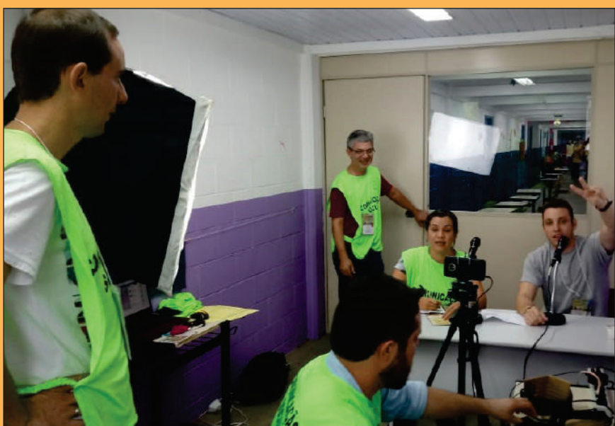
Comunicação Social em ação na cidade de São Carlos (SP)

Boa Vista (RR) Dourados (MS) Lucas do Rio Verde (MT) Piranhas (AL) São Carlos (SP)