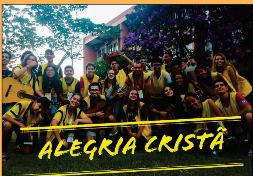
Jovens levaram animação e arte para Dourados (MS)

Boa Vista (RR) Dourados (MS) Lucas do Rio Verde (MT) Piranhas (AL) São Carlos (SP)