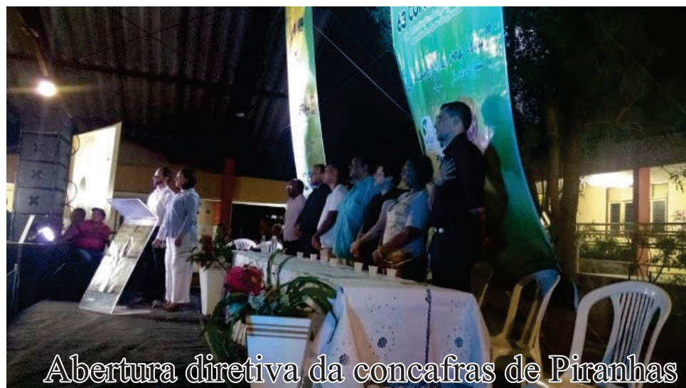
Abertura diretiva da concafrás de Piranhas